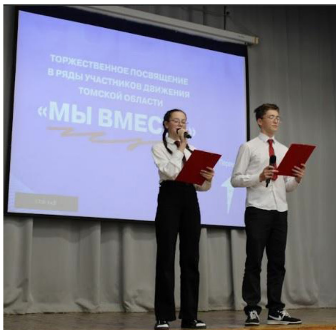
ПОСВЯЩЕНИЕ В РДДМ «ДВИЖЕНИЕ ПЕРВЫХ»