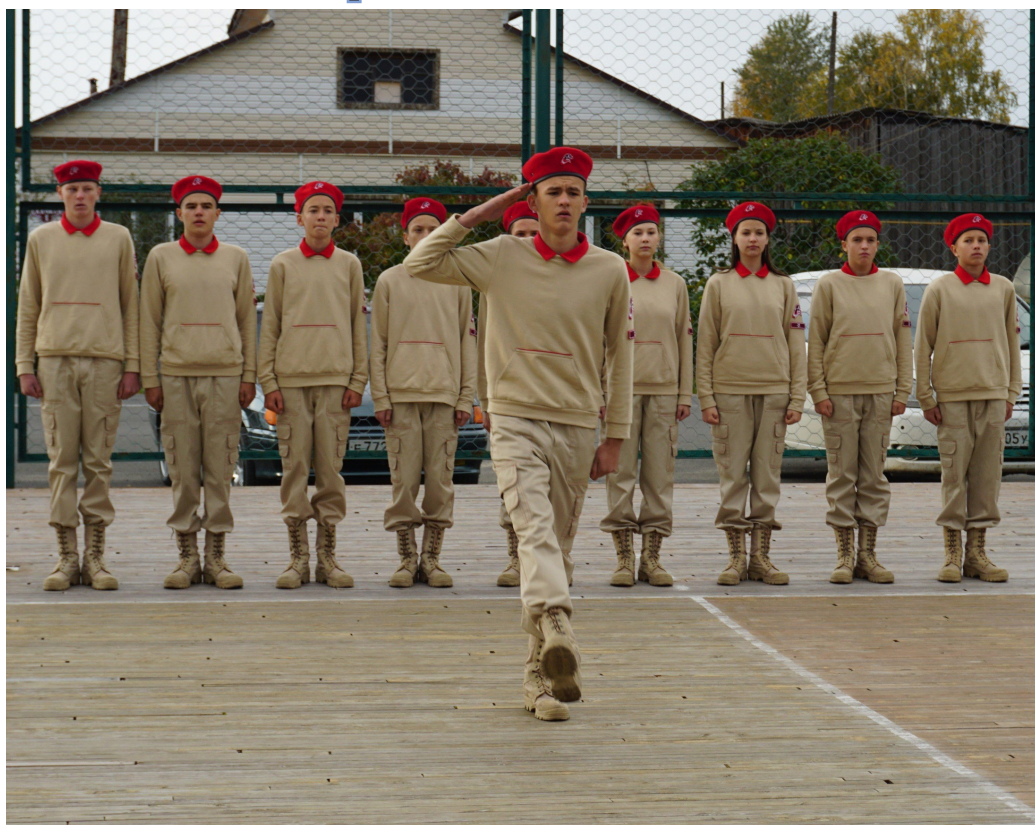
На фото команда МБОУ «Каргасокская СОШ № 2»

Патриотическое воспитание включает в себя формирование патриотического сознания, воспитание верности своему Отечеству, готовности к выполнению гражданского долга и конституционных обязанностей по защите