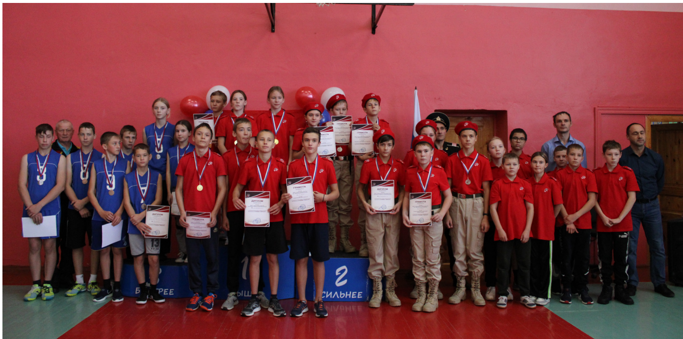
На фото участники соревнований «Семеро смелых» после подведения итогов и награждения

Военно-спортивные игры и соревнования являются составной частью многочисленных форм работы в системе военно-патриотического воспитания школьников.