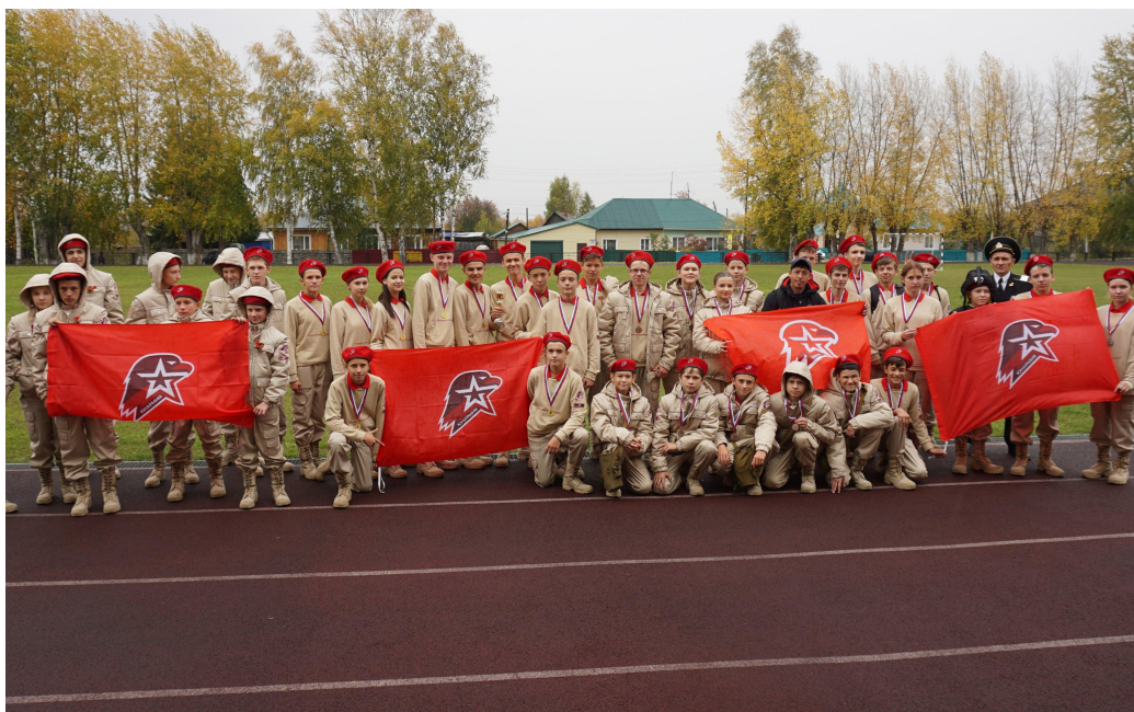
На фото представлены все команды соревнований «Зарница - 2023»

Все участники остались довольны результатами и пожелали друг другу хорошего начала нового учебного года!