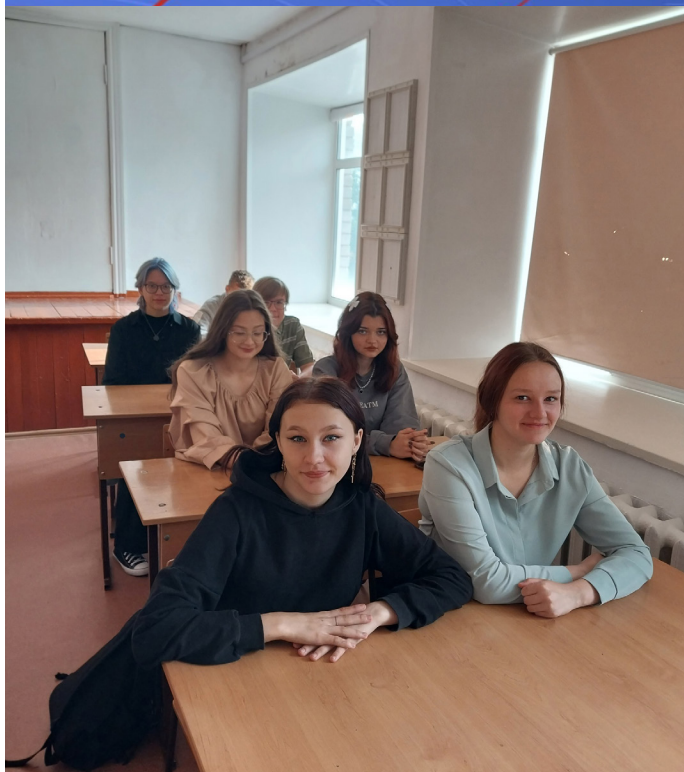
На фото ребята 9 «В» класса на классном часу «Разговоры о важном» - сентябрь 2023г.