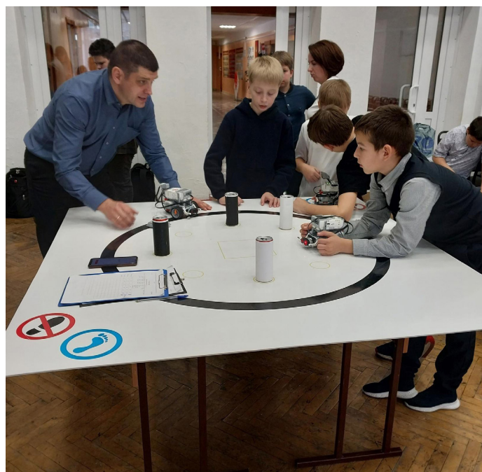
IX соревнования по робототехнике на Кубок Губернатора Томской области