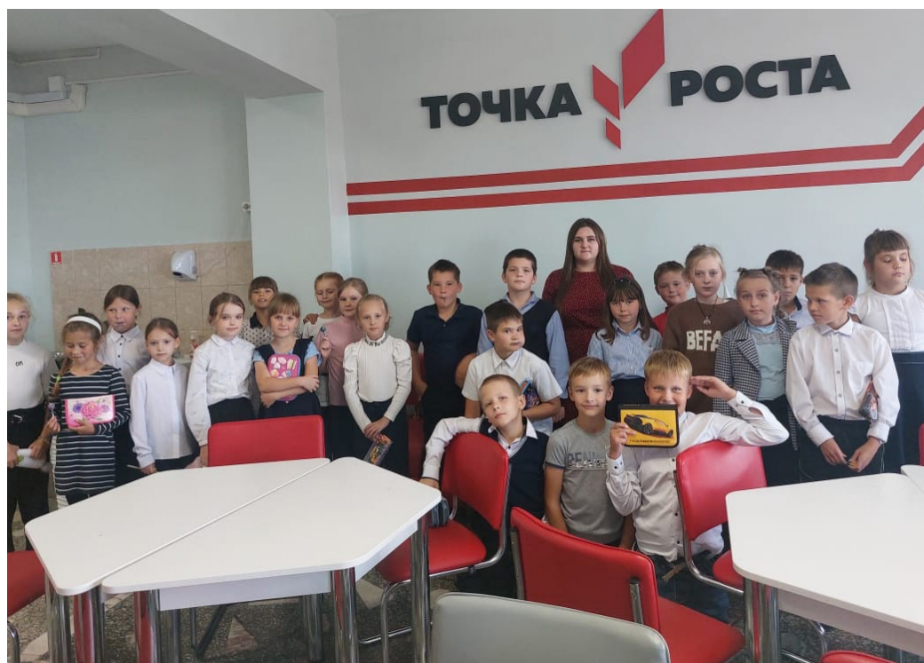
На фото ребята участвующие в мероприятии «Знатоки ПДД» в центре «Точка роста»

Ребята справились со всеми поставленными задачами и были награждены сладкими призами.