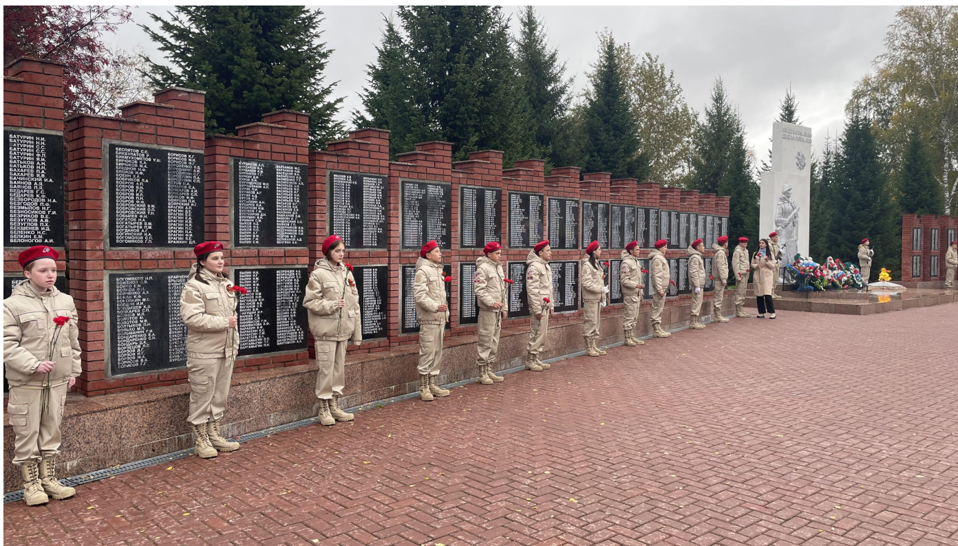
На фото Юнармейцы МБОУ «Каргасокская СОШ № 2» участвующие в митинге