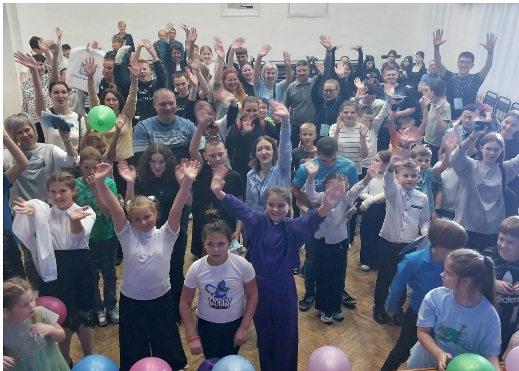
На фото участники фестиваля «Технопредки-2023»