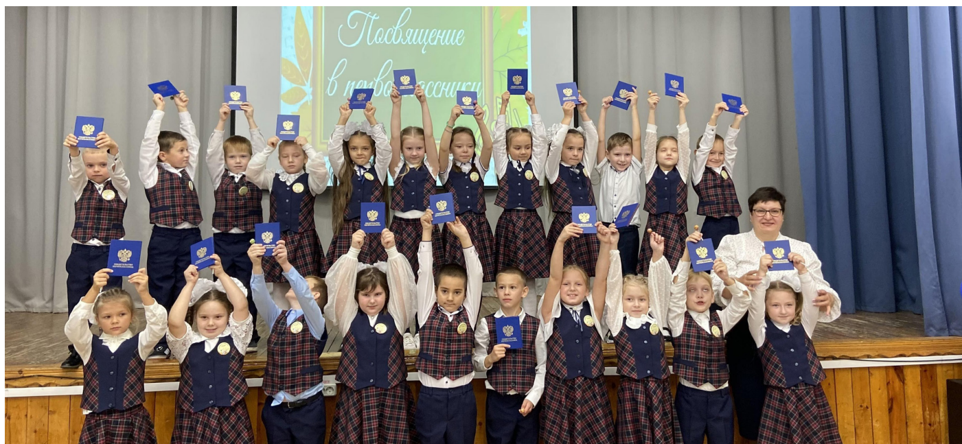
ПОСВЯЩЕНИЕ В ПЕРВЫЙ КЛАСС